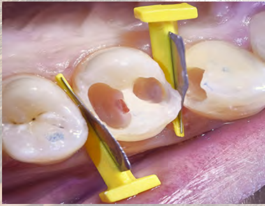
5 Confection d'un moule pour couler la Biodentine