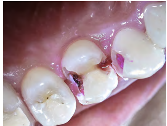
2 Ouverture de la carie (étendue dans la dent 13), colorant de carie