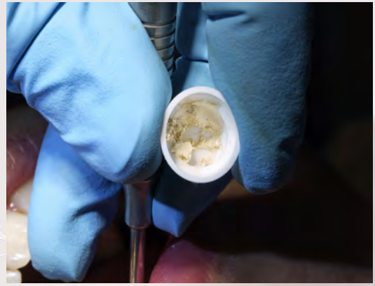
6 Préparation du ciment dentaire Biodentine