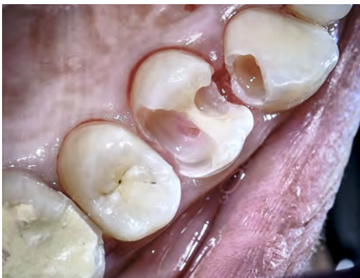
3 Curetage des caries, puple à nu