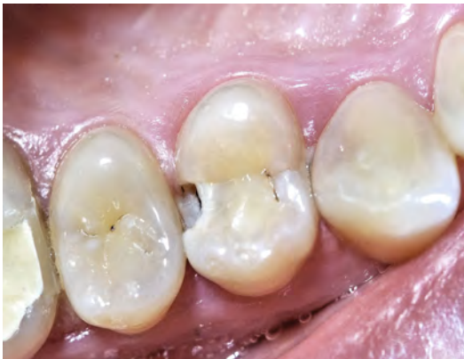
1 Carie sur la prémolaire supérieure droite (dent 14)