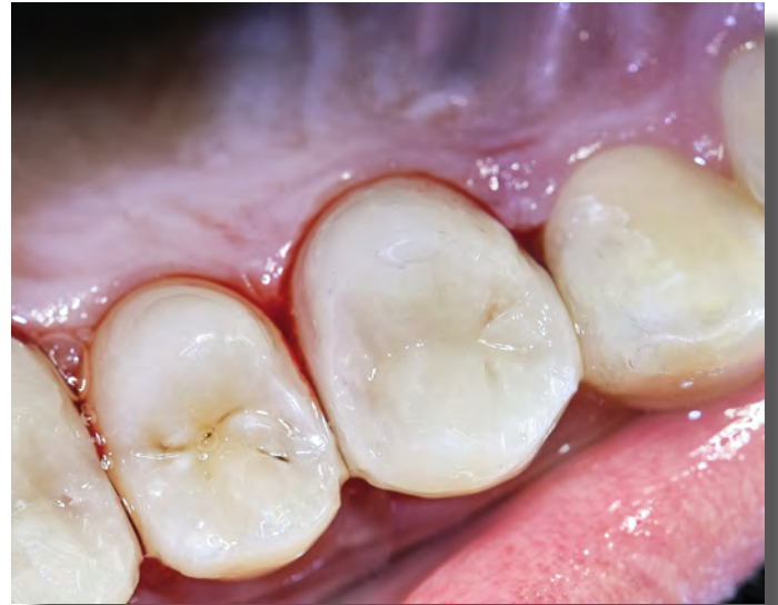
DENTS APRÈS TRAITEMENT