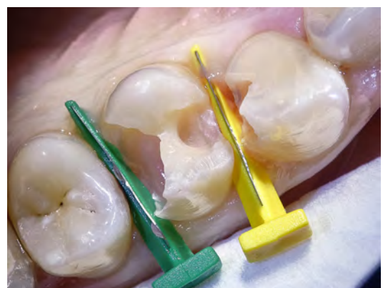
4 Pose de «matrices»