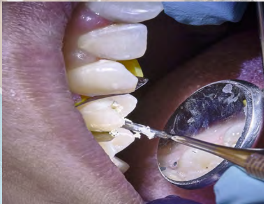
7 Remplissage de la dent