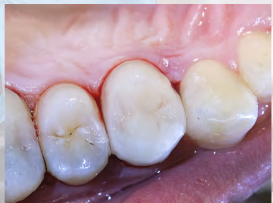
10 Résultat final