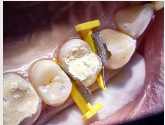
8 Biodentine coulée