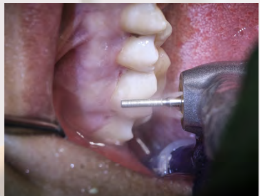
9 Sculpture de la dent