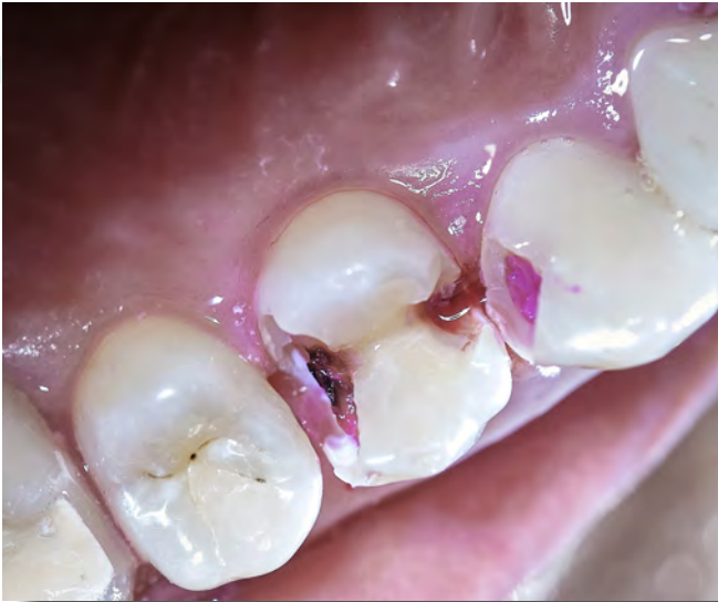
CARIES AVANT TRAITEMENT